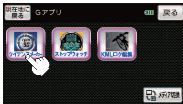
ケイデンスメーカー起動時