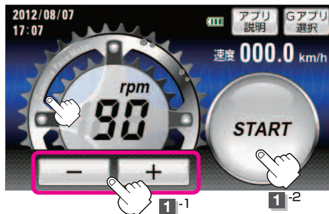
ケイデンスメーカー「スタート」