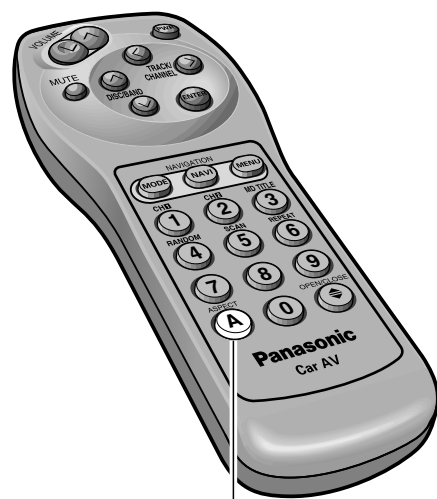
アスペクト A (ASPECT)