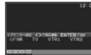
リアモニター設定画面