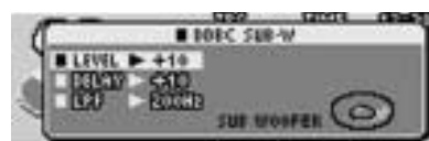
DDBC サブウーファー出力設定画面

外部アンプに内蔵された調整機能を使用する場合は本機のディレイ時間を「0 ms」、カットオフ周波数を「OFF」にしてください。