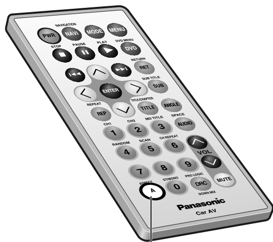
アスペクト A (ASPECT)