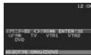
リアモニター設定画面