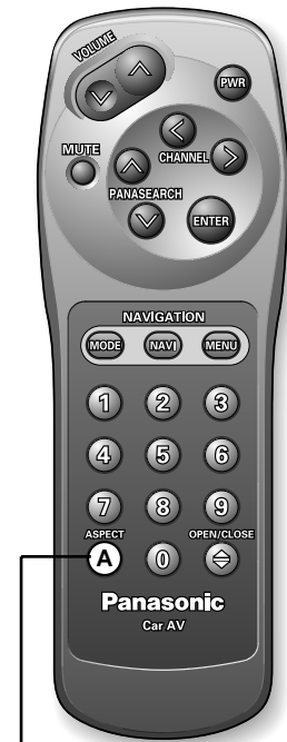
A (ASPECT) ボタン