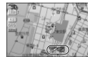
ナビゲーションがONのとき

本機でナビゲーションの映像・音声を出力しながら、TV (またはVTR) の音声をFMトランスミッターで出力します。