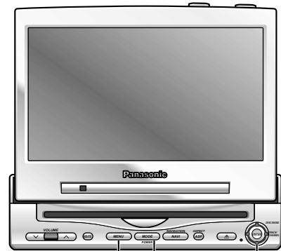
メニュー モード ジョイスティック " # % $ MENU MODE エンター ENTER

CA-TU9200D/TU7200Dを接続すると、本機にナビゲーションを接続したときのナビゲーションの音量や、ナビミュート時に本機が音量を絞る割合を設定できます。