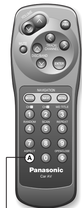
A (ASPECT) ボタン