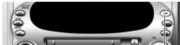
ダイレクトメモリー D·M

電源が切れているときでも、どのモードからでも、ボタン一つで交通情報を受信できます。(ダイレクトメモリー) また、お好きな放送局を記憶させることもできます。(初期設定: AM 1 620 kHz)