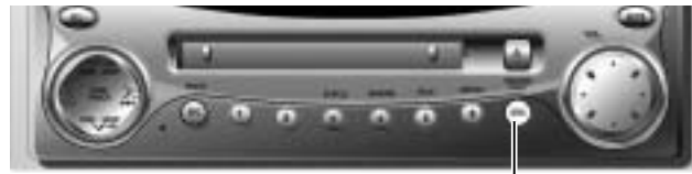
ソース SRC (SOURCE)