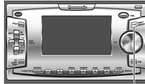
ダイレクトメモリー D・M (DIRECT MEMORY)

電源が切れているときでも、どのモードからでも、ボタン一つで交通情報を受信できます。(ダイレクトメモリー) また、好きな放送局を記憶させることもできます。(初期設定: AM 1 620 kHz)