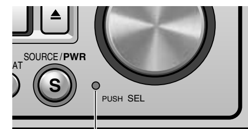
リセットスイッチ

リセットしても正常に戻らない場合は お買い上げの販売店、またはお近くの「ご相談窓口」(別紙)に修理をご依頼ください。