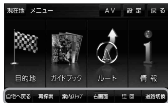
クイックメニュー