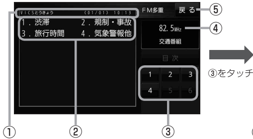
(例)文字表示(レベル1)目次画面