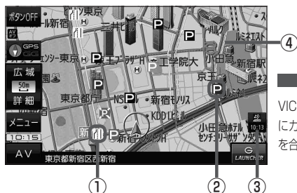
(例) 現在地の地図画面