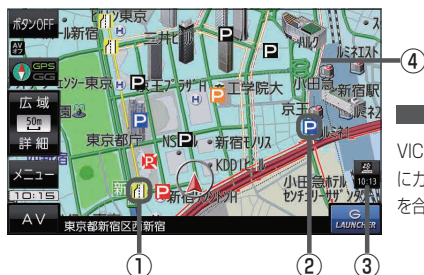
(例) 現在地の地図画面