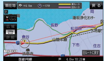
(例)新旧ルート比較画面表示