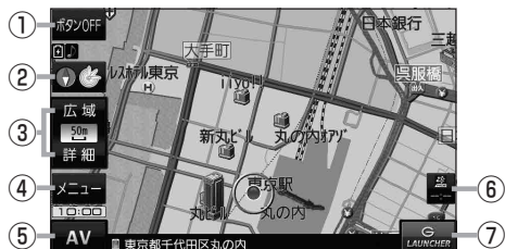
(例) 現在地の地図画面