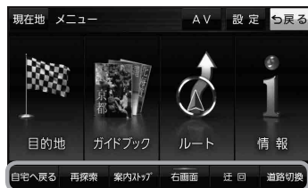
クイックメニュー