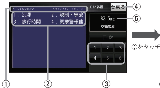
(例)文字表示(レベル1)目次画面