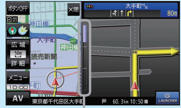
(例)交差点拡大表示