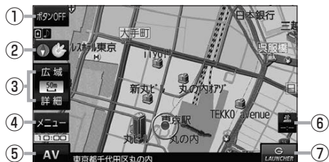
(例) 現在地の地図画面