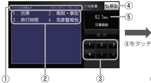
(例)文字表示(レベル1)目次画面