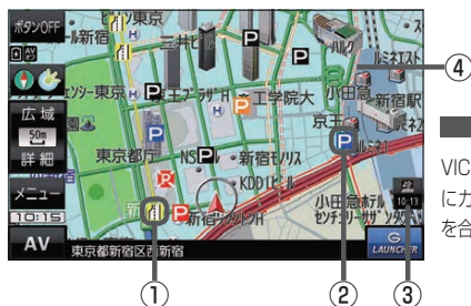
(例) 現在地の地図画面