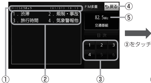
(例)文字表示(レベル1)目次画面