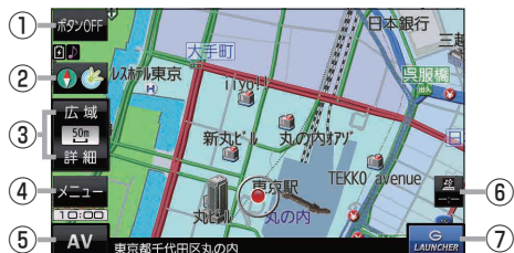
(例) 現在地の地図画面