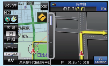
(例)交差点拡大表示