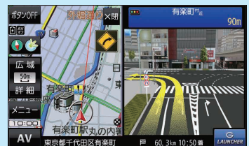
(例)リアル3D交差点表示