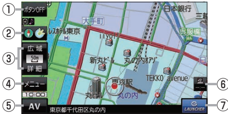
(例) 現在地の地図画面