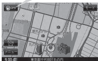
現在地表示画面(例)