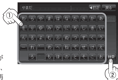
電話番号登録者名入力画面

※該当するデータが収録されていない場合は地図は表示されません。入力した名字を確認のうえ、もう一度入力直してください。