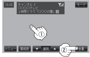
操作ボタン表示画面