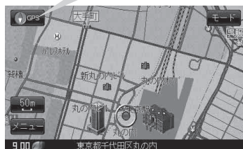
現在地表示画面(例)