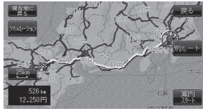
全ルート表示画面(例)