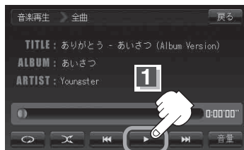
一時停止状態画面(例)