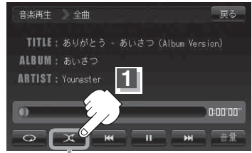
ランダム ボタン(ランダム)