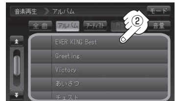
アルバムリスト画面(例)