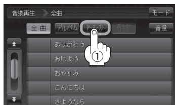
全曲リスト画面(例)