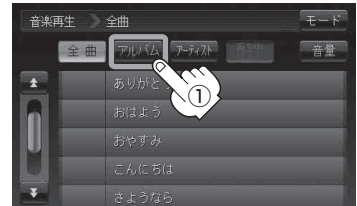
全曲リスト画面(例)