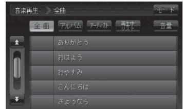
音楽再生一覧画面(例)