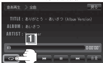
リピート再生画面(例)

※もう一度 🔄 ボタン(リピート)をタッチするとリピートボタンが消灯し、通常再生に戻ります。