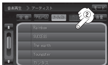
アーティストリスト画面(例)