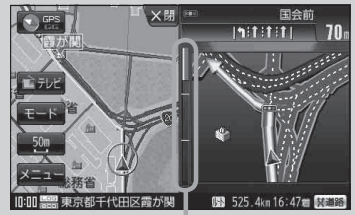
(例) 交差点拡大表示