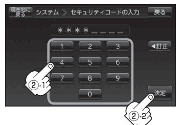
セキュリティコード入力画面