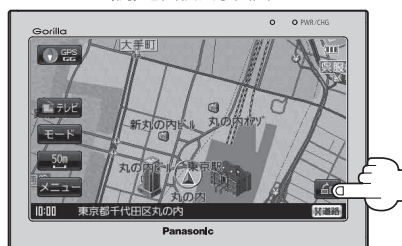
(例) 地図横表示画面