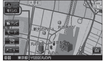
電子コンパス状態表示