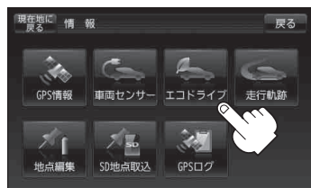
(例)エコドライブ情報画面*

※ この評価は本機独自の評価です。葉の数が5つのときはA、4つのときはB、3つのときはC、2つのときはD、1つのときはE評価です。葉の数が多いほど環境にやさしく、無駄の少ない運転ができていることを意味します。