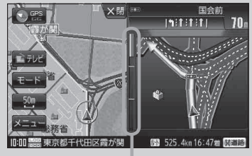
(例) 交差点拡大表示