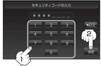
セキュリティコード入力画面