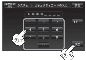
セキュリティコード入力画面