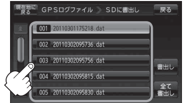
(例)GPSログファイル一覧画面