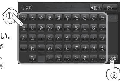
電話番号登録者名入力画面