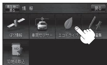
エコドライブ情報画面(例)☆

総合評価……………総合評価をA～Eの5段階で判定 ※この評価は本機独自の評価です。葉の数が5つのときはA、4つのときはB、3つのときはC、2つのときはD、1つのときはE評価です。葉の数が多いほど環境にやさしく、無駄の少ない運転ができていることを意味します。