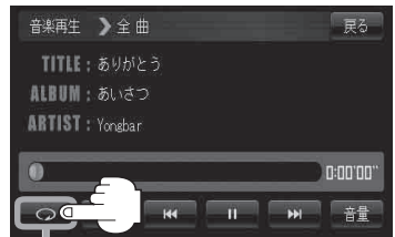
リピート ボタン(リピート)