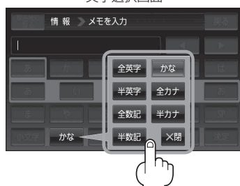
(例) 全カナ を選択した場合