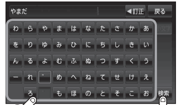
電話番号登録者名入力画面*

※該当するデータが収録されていない場合は地図は表示されません。入力した名字を確認のうえ、もう一度入力し直してください。