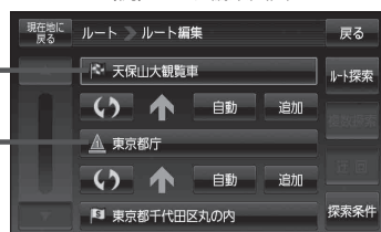
(例)ルート編集画面