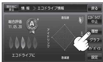
(例)エコドライブ情報画面