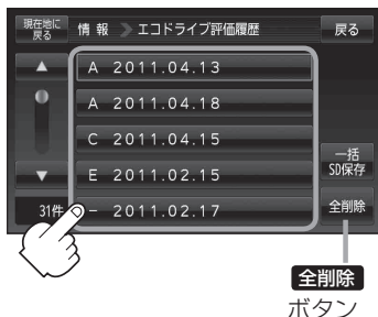
(例)エコドライブ評価履歴画面